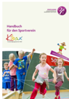
Handbuch für den Sportverein