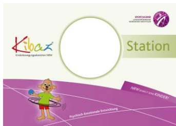
10 Stationskarten DIN A4