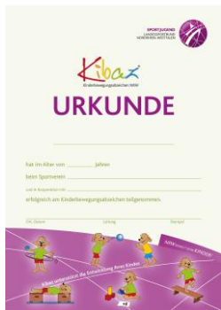
Urkunde DIN A4