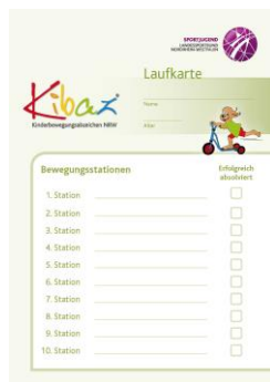
Laufkarte DIN A5